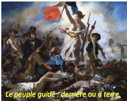
Le peuple guidé : derrière ou à terre

[...] gouvernement du peuple, par le peuple et pour le peuple 2 .