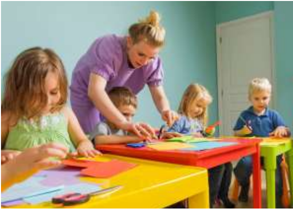
Le savoir vient d'en haut

Évidemment, les questions et les débats portent alors sur « des droits, à quoi ? » et « comment ? » – tout comme en éducation, les innombrables commentaires et disputes depuis des siècles portent sur « éduquer à quoi ? » et « comment ? ». Et si rarement sur « pourquoi ? » un intérêt supérieur de l'enfant ou pourquoi une éducation ? La formule « l'intérêt supérieur de l'enfant » s'analyse sur deux points, que le terme de « supérieur » laisse entrevoir : la domination sur un « autre » et la faiblesse, voire l'inanité, de ce concept 9 .